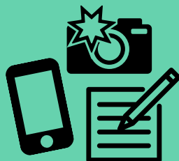
사진 촬영이나 녹화, 또는 현장 상황을 자세히 기록할 수 있는 권리가 있습니다.

정부 기관 관계자가 집 안으로 들어오려고 할 때, 이를 거절할 수 있는 권리가 있습니다. 또한, 영장이 없는 경우에는 집, 차량, 신체에 대한 수색을 거부할 수 있습니다.